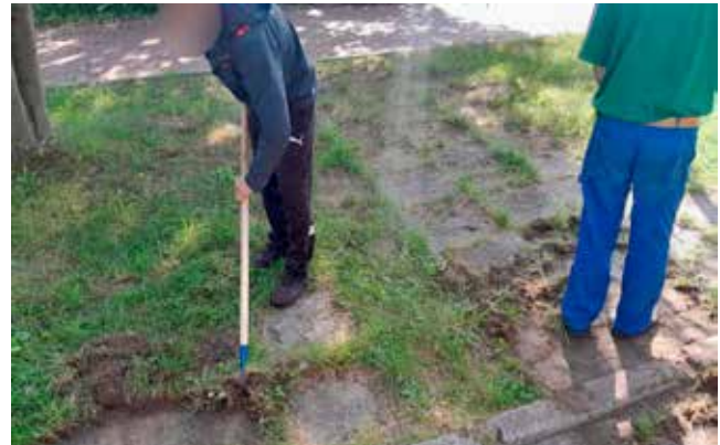
Zamiatanie i hakanie brzegów jezdni dojazdowej na stadion miejskim