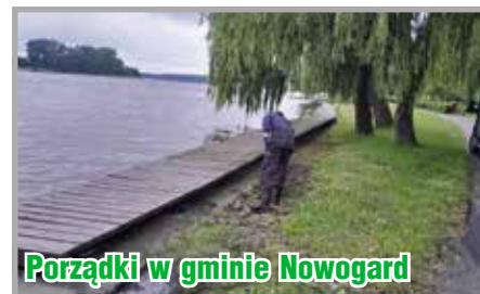
Porządki w gminie Nowogard