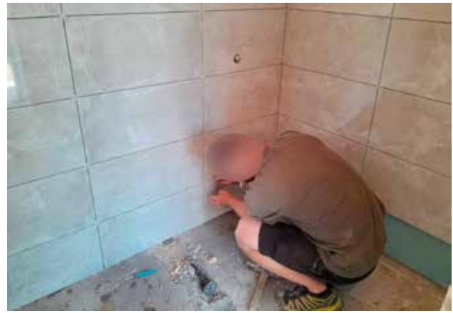
Remont natrysków na stadionie miejskim