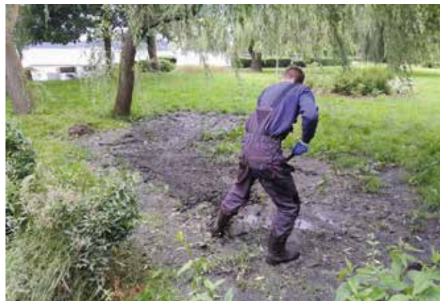
Porządki gminne - sprzątanie po silnych ulewach na zieleńcach i wzdłuż murkach przy jeziorze