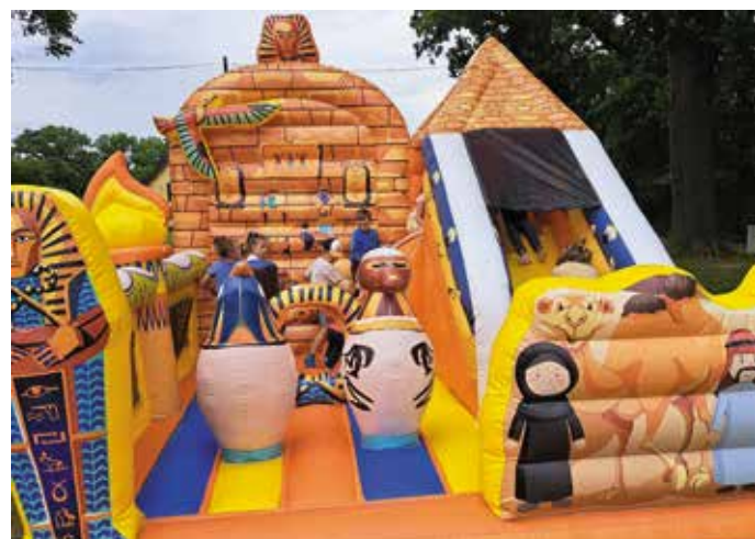
Dzień Dziecka w Karsku