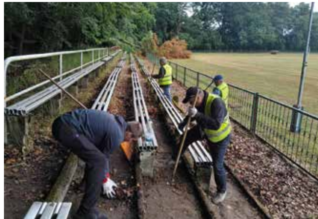
Porządki gminne - prace porządkowe na stadionie