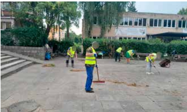
Zamiatanie i hakanie krawężników, płyt chodnikowych, schodów za pomnikiem