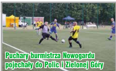
Puchary burmistrza Nowogardu pojechały do Polic i Zielonej Góry