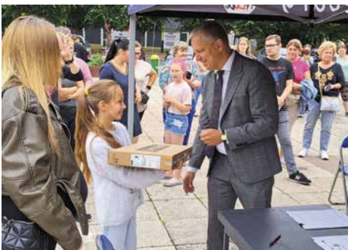
Kolejne laptopy rozdane