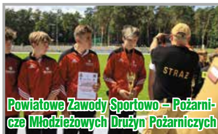
Powiatowe Zawody Sportowo – Pożarnicze Młodzieżowych Drużyn Pożarniczych