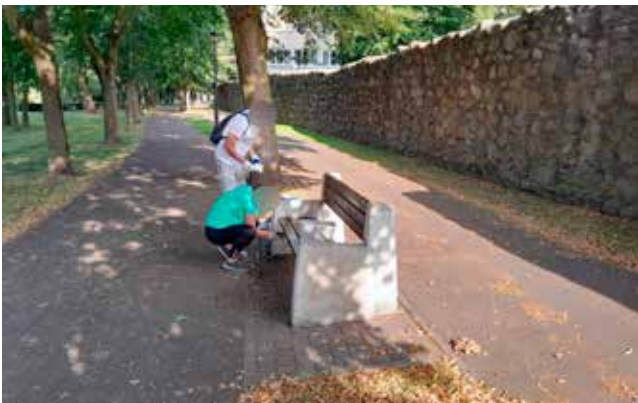
Zamiatanie pod ławkami i czyszczenie ławek przy murach miejskich

II LICEUM OGÓLNOKSZTAŁCĄCE 72-200 Nowogard, ul. Boh. Warszawy 78 Tel. 91 29 25 107, Tel./Fax 91 29 25 494