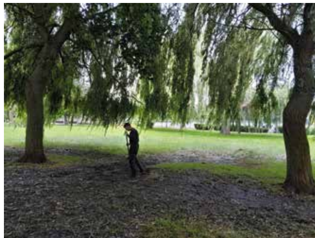
Porządki gminne - hakanie i sprzątanie ścieżek pieszo rowerowych